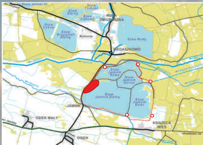
STAWY MILICKIE- KOMPLEKS JAMNIK MIEJSCE OBSERWACJI CZAPLI ●