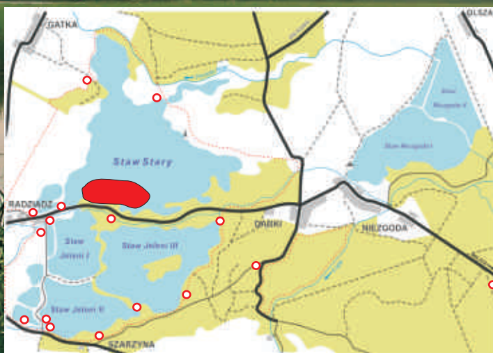
STAWY MILICKIE- KOMPLEKS RADZIADZ MIEJSCE OBSERWACJI CZAPLI ●