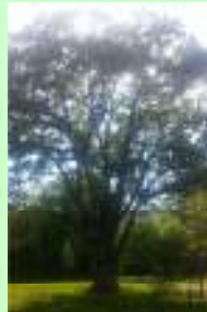
Pomnik przyrody- dąb Melchior Wiek około 390 lat Obwód 632 cm