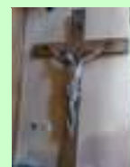
krucyfiks-najstarsza rzeźba Doliny Baryczy