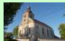
kościół pw. św. Jana Chrzciciela