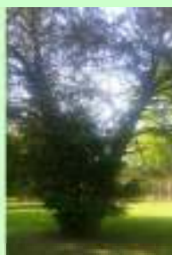
Pomnik przyrody Cis pospolity

Fontanna w stawie zamkowym, w którym można popływać kajakiem.